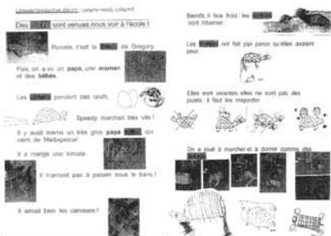
Production d'écrit : compte-rendu collectif

Si l'aspect pédagogique ne laissait aucun doute quant aux résultats, c'est l'aspect psychologique qui a le plus étonné. Dans un petit courrier qu'elle a adressé à Serge suite à cette prestation, la maîtresse écrit « certains enfants qui ne parlaient pratiquement pas jusqu'alors, se sont 'débloqués' avec la venue de