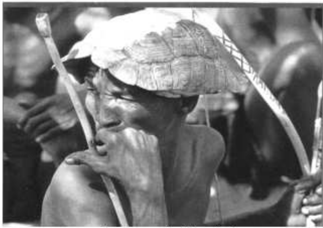
Bushman de Namibie