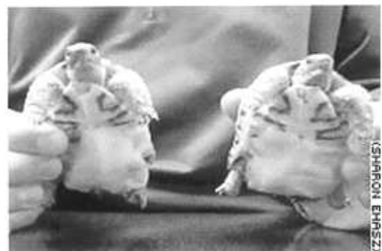
Longue vie à ces miraculées

Les deux tortues ont été séparées lors d'une opération sous anesthésie qui a duré un peu plus de 3 heures. Leur pronostic de survie est bon, même pour Jelly dont l'intestin est très court, une partie ayant servi à créer un 'estomac'.