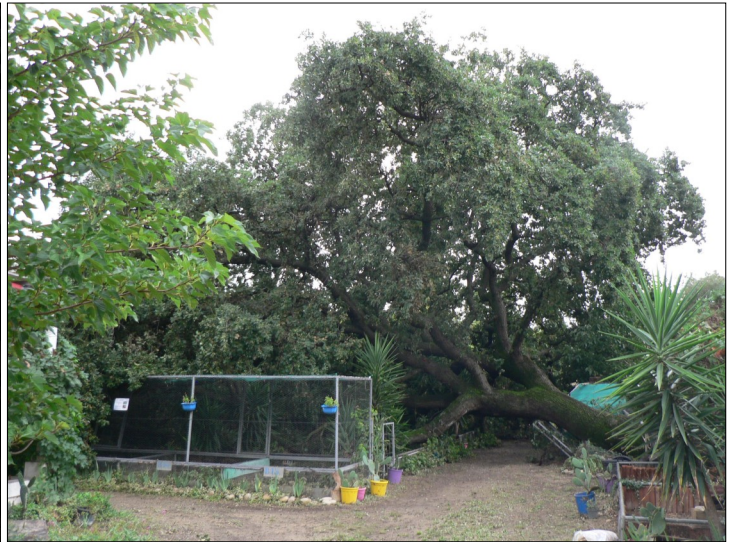
La même prise de vue 25 ans plus tard Plus d'ombre, les branches sont au sol