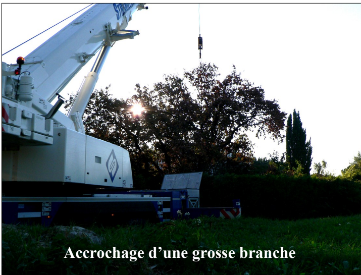
Accrochage d'une grosse branche