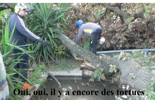
Oui, oui, il y a encore des tortues

Quelques photos explicatives des diverses opérations successives pour enlever le chêne des bassins.