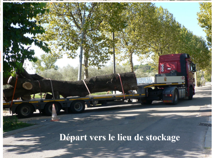
Départ vers le lieu de stockage

Le tronc est parti pour être entreposé au CTM de Vergèze où il séchera en attendant un sculpteur.