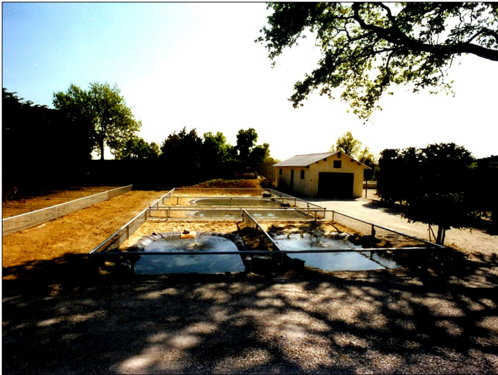
Une des première photo du Jardin des Tortues. On ne voit du chêne qu'une branche et son ombre au sol