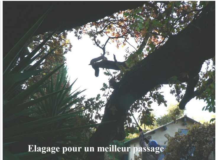
Elagage pour un meilleur passage