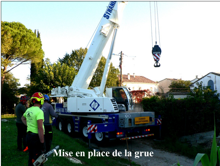
Mise en place de la grue