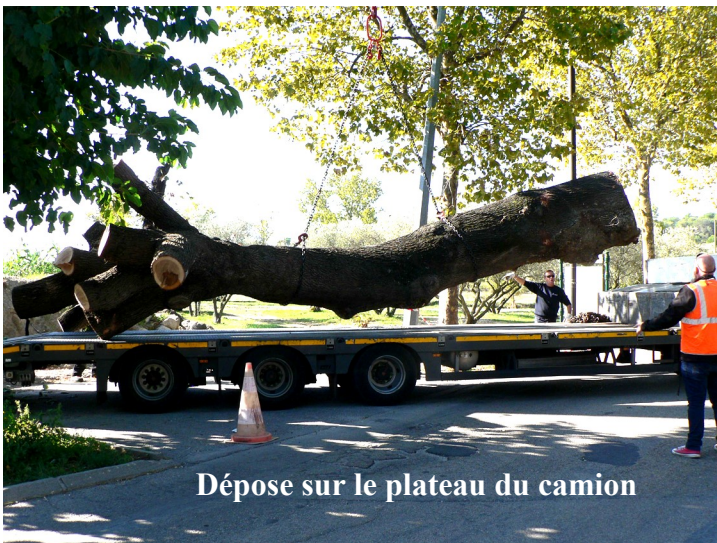
Dépose sur le plateau du camion