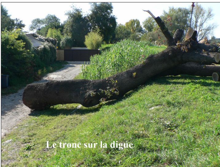
Le tronc sur la digue