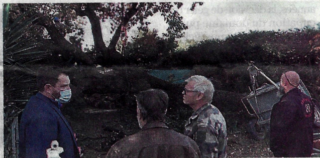
Une situation qui a posé pas mal de questions.

Elles ont eu chaud les tortues du parc qui les accueille à la sortie de Vergèze. Elles ont eu chaud dans leurs enclos car, lors de la tempête du 14 septembre, non seulement elles ont subi les inondations, ce qui a profité à quelques-unes qui ont pris la poudre d'escampette. Mais aussi parce qu'un superbe chêne plus que bicentenaire, planté en clôture, sous lequel Saint-Louis n'aurait pas renié rendre la justice les voyant prisonnières depuis tant d'années, a profité de l'aide des fortes bourrasques pour tenter d'aller les délivrer. Les services espaces verts de la ville, alertés, ont demandé d'attendre pour dégager ce monstre de verdure et de