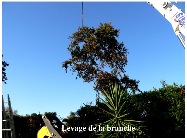
Levage de la branche