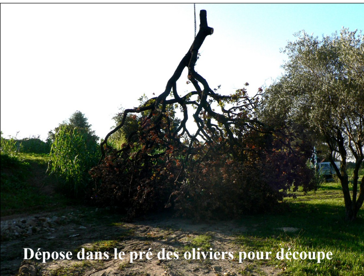
Dépose dans le pré des oliviers pour découpe