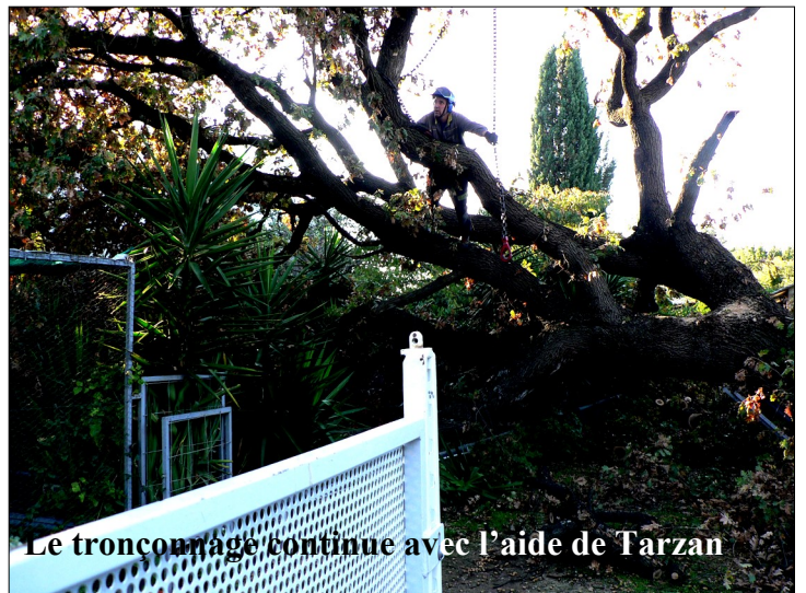
Le tronçonnage continue avec l'aide de Tarzan