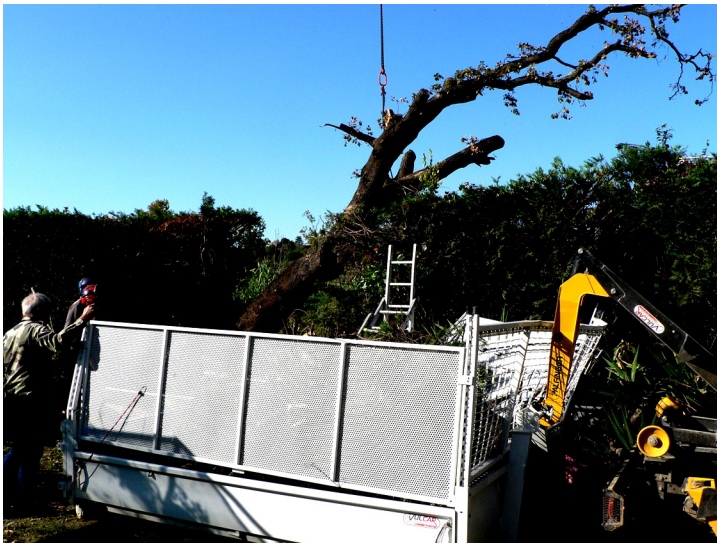
La dernière branche ne souhaitait pas quitter le jardin, elle a renversé la benne, heureusement sans gros dégâts.