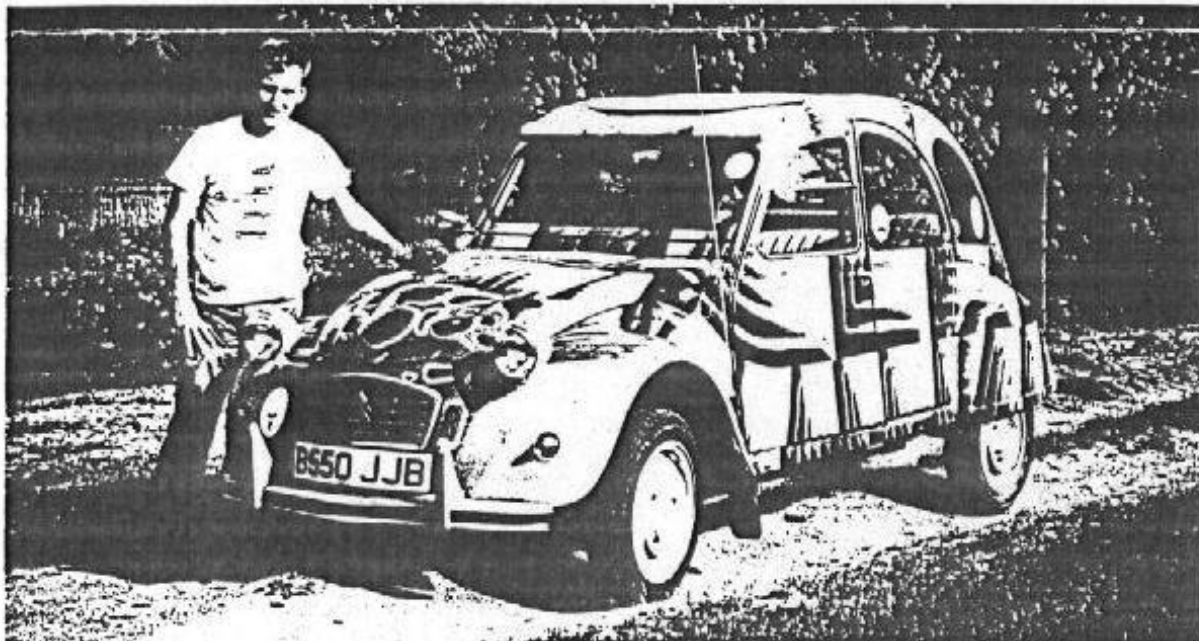
la fameuse 2 CV.Tortue, prêtée par la FFPS ( Citroen Angleterre )

Ceci représente l'essentiel denos travaux 86 ; mais d'autres actions pourront être envisagées, selon nos disponibilités financières, et les aides que nous recevrons. Prochain bulletin ; en Mai 86.