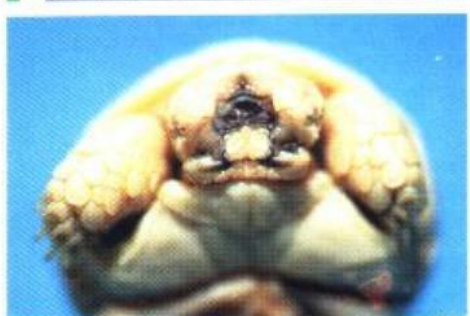
monstres et curiosités