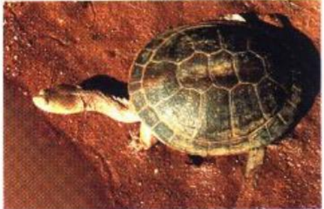
les tortues australiennes